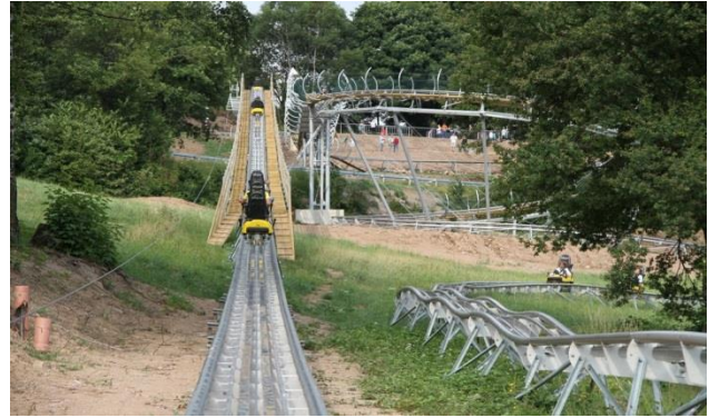
Sommerrodelbahn in Wald Michelbach