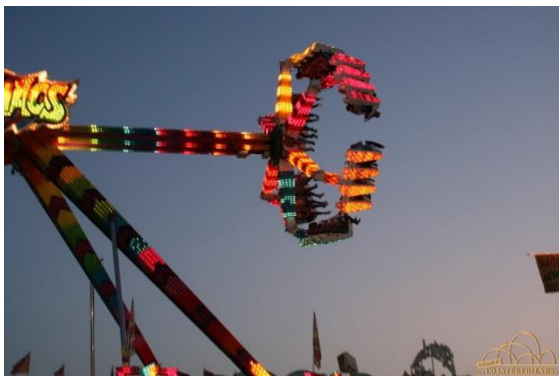
Pferdemarkt in Beerfelden vom 07.07. bis 10.07.