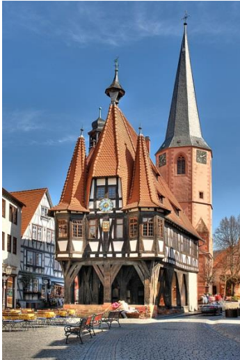
Rathaus in Michelstadt