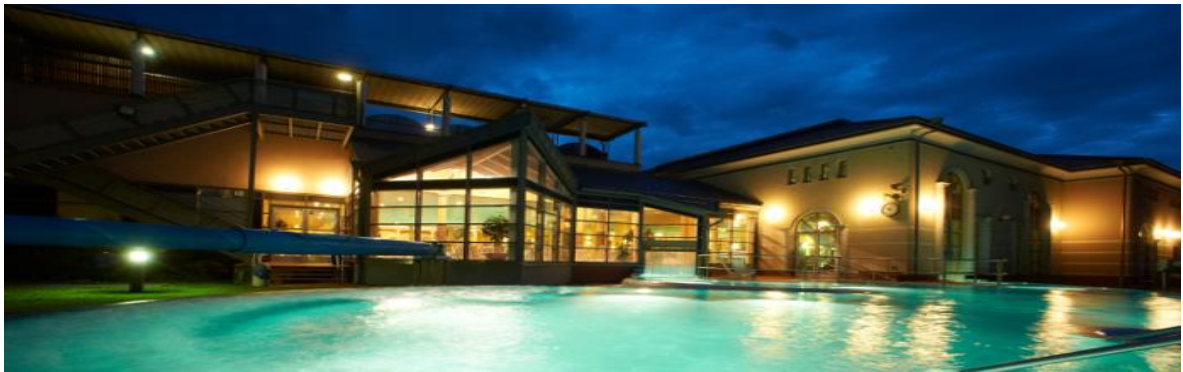
Odenwald- Therme in Bad König